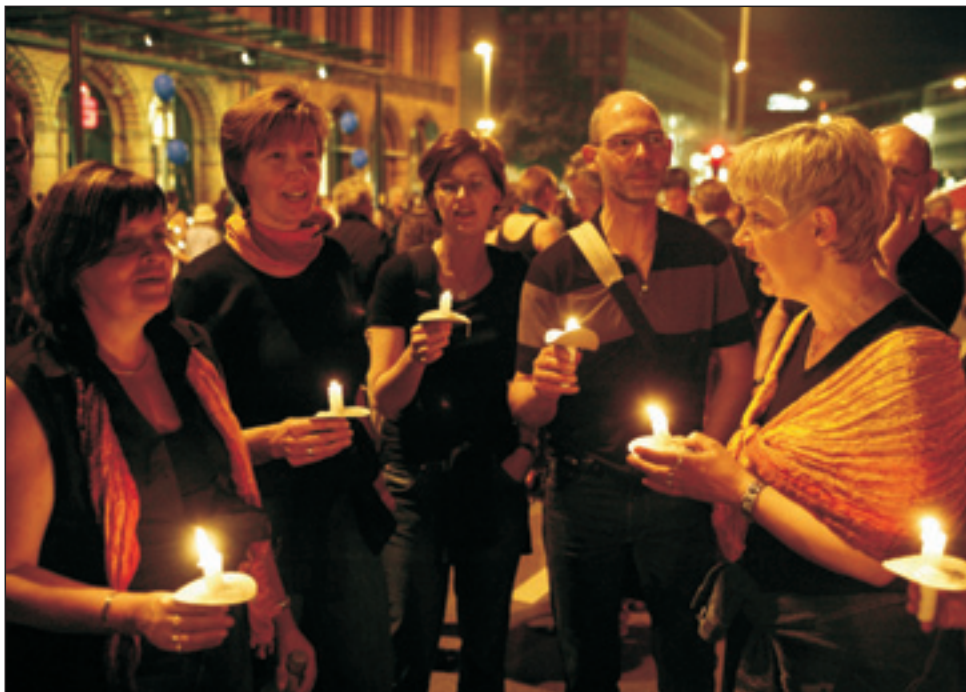
Mit einer stimmungsvollen Lichterkette klingt der „Abend der Begegnung“ aus.