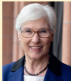
Dr. Irmgard Schwaetzer Präses der Synode der Evangelischen Kirche in Deutschland

Eine Begrenzung auf ein „Genug“ ist dringend geboten. Der christliche Glaube kann uns dabei helfen: Weil ich im Vertrauen auf Gott alles habe, was ich zum Leben brauche, werde ich frei, mich um anderer Willen zu begrenzen. Das meint Martin Luther mit der „Freiheit eines Christenmenschen“. Das muss kein schmerzlicher