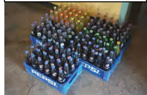
Cola, Orangen-Fanta, Ingwer: lecker!

Nach dem Gottesdienst Kakao und Kekse. Dann besonders Gutes zum Essen, Pilau mit Hühnchen. Zur Feier des Tages eine Soda.