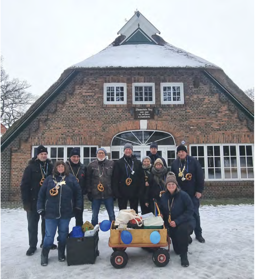
Kohlfahrt mit Schnee!