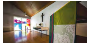
Gottesdienst in Emden

Sonntag, 16.08.2026 15.00 Uhr Gottes- dienst Christuskirche in Leer (!), Hoheel- lernweg 2-4, 26789 Leer, anschl. Tee & Gespräch