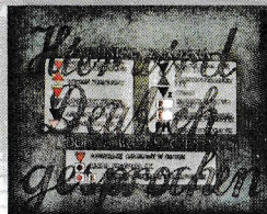
Museum Auschwitz Hartmut Berlinicke