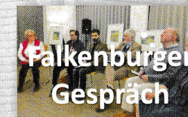
„Schuld und Vergebung“