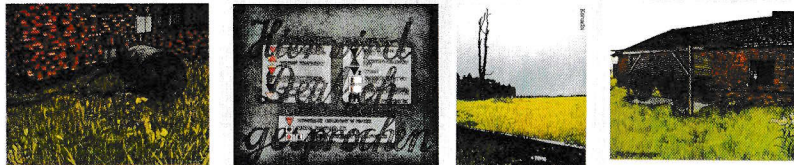
„Museum Auschwitz - Bilder von Hartmut Berlinicke

Die Ausstellung „Museum Auschwitz“ ist zu allen Veranstaltungen im Falkenburger Konventshaus oder auch auf Anfrage zu sehen.