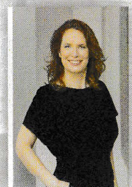
Musik von Stefanie Golisch